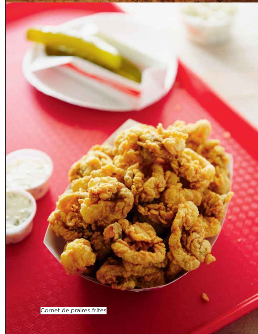
Cornet de praires frites