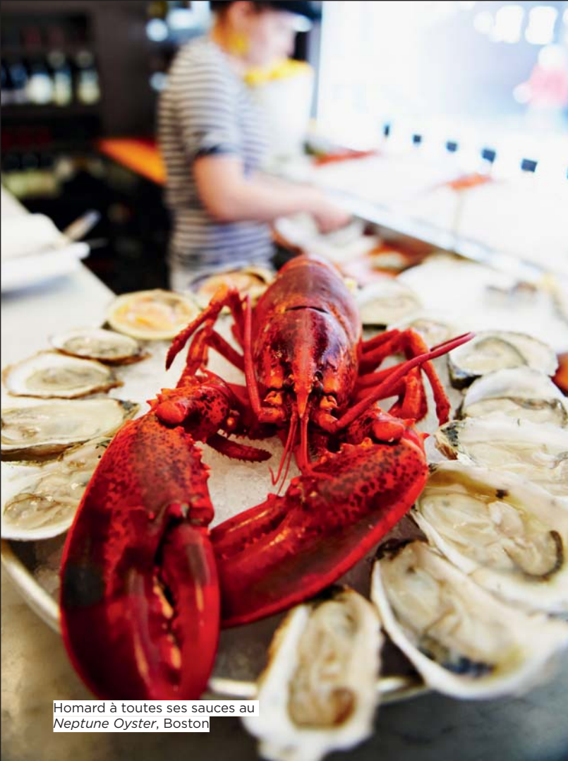
Homard à toutes ses sauces au Neptune Oyster, Boston