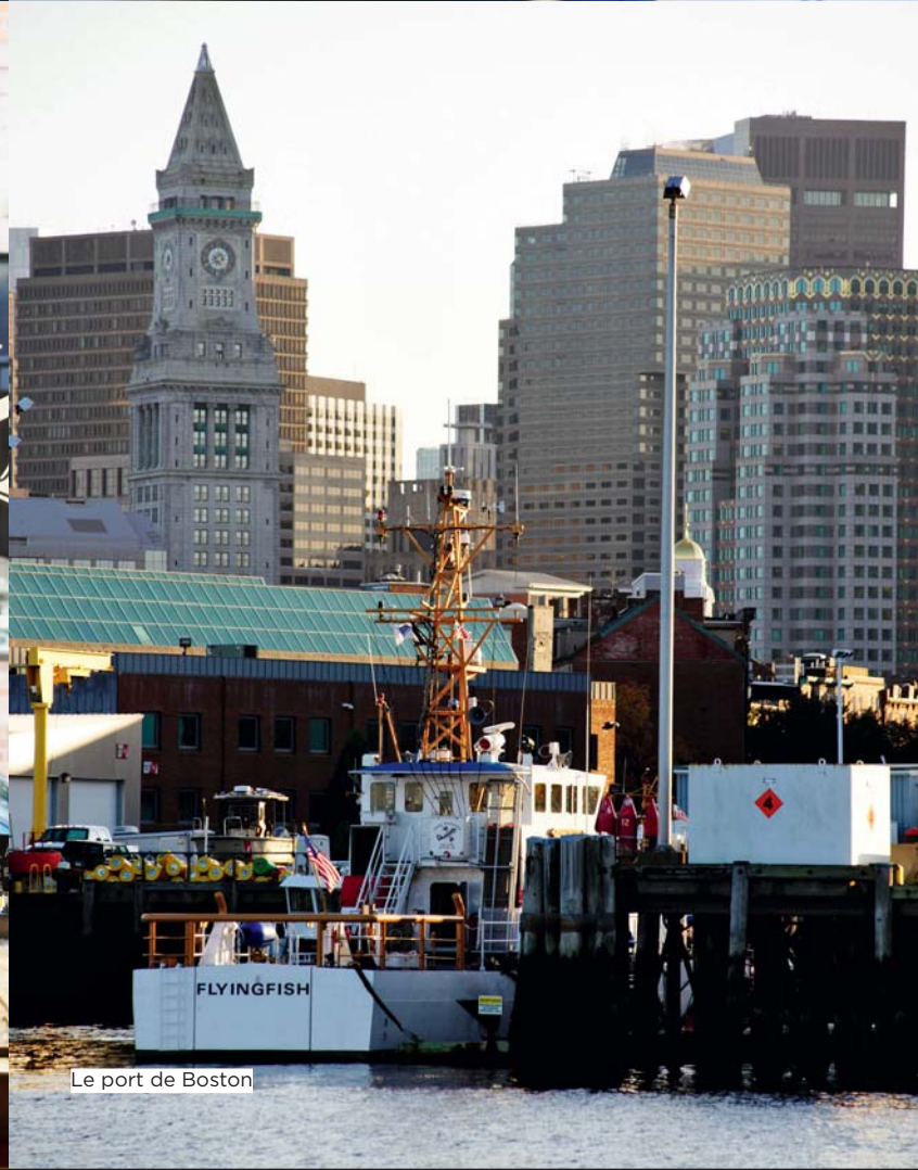
Le port de Boston