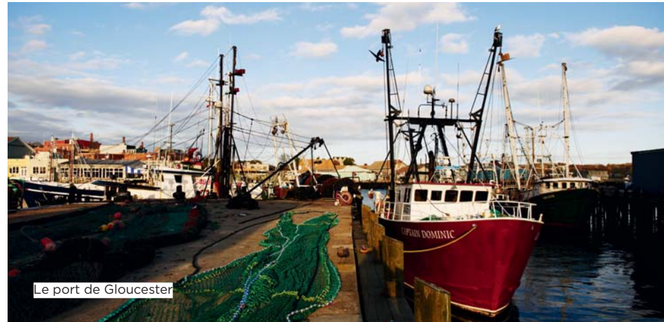
Le port de Gloucester